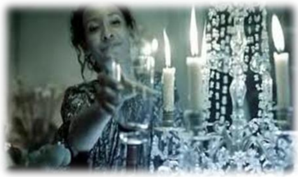
2.8.5. „ელიტურ-პრესტიჟული პერსონა“ იაგუარის რეკლამიდან “Gorgeous”

Gorgeous deserves your immediate attention.