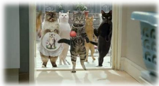
2.6.6. კადრი „ქრევენდეილის“ რძის პროდუქტების რეკლამიდან, რომელშიც დომინანტურად წარმოდგენილია ცხოველების პერსონიფიკაცია.

(ბრიტ.). მაგალითად, ქრევენდეილის (“Cravendale”) რძის პროდუქტის ერთ-ერთი ძალზე პოპულარული რეკლამა, ( http://www.youtube.com/watch?v=yxkV4A6zB_A 2011), რომელშიც მთავარ რიტორიკულ ხერხად გამოყენებულია ცხოველების, კერძოდ, კატების პერსონიფიკაცია.