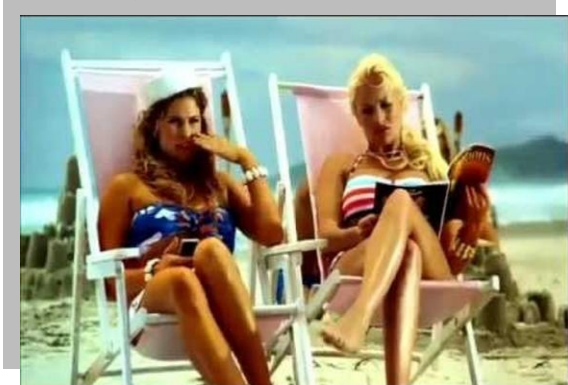
2.6.7. კადრი მინი კუპერ-ის ფორმის ავტომობილის რეკლამიდან.

რეკლამას თვალს ვერ მოსწყვეტს, როგორც კი დაინახავს აუდიტორიასთან პირველი კონტაქტის ეტაპზე წარმოდგენილ სანახაობას.