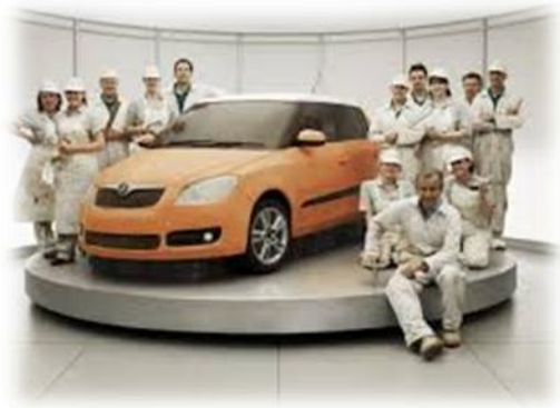
2.6.5. კადრი შკოლა ფაბიას ფირმის რეკლამირებული მანქანის რეკლამიდან.

„გემრიელის“ ეფექტი- ხშირად კომუნიკატორები აუდიტორიის ემოციურ დარწმუნებას დომინანტური გემოს ეფექტის შექმნითაც ცდილობენ. ბუნებრივია, ასეთი ტიპის რეკლამები უმეტესად საკვების, რესტორნებისა და სხვა სასააღილო პუნქტების პროდუქციას უკეთდება, თუმცა გამონაკლისებიც არსებობს. ვფიქრობთ, ამ მხრივ საინტერესოა