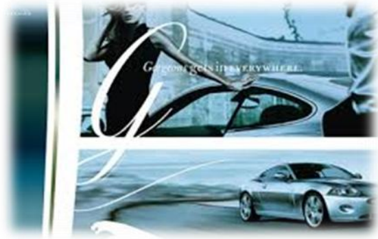
2.8.4. რიტორიკული სიტუაცია იაგუარის რეკლამიდან “Gorgeous”