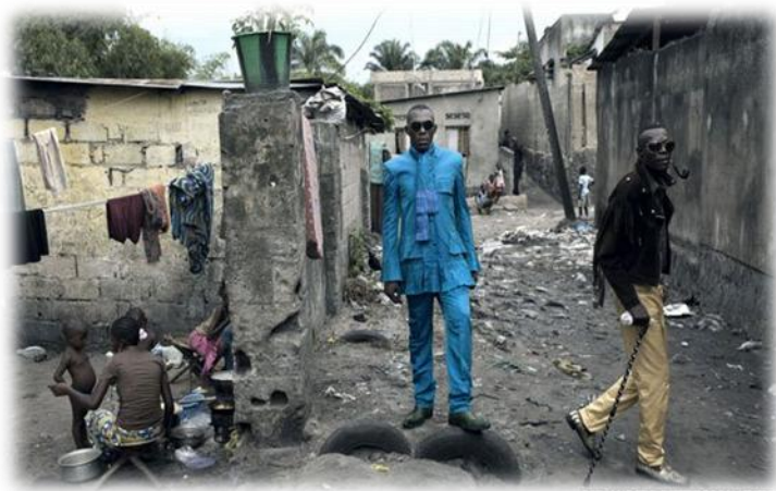
4.2. კონგოს „ელეგანტური ადამიანებისგან შემდგარი საზოგადოების“ წარმომადგენლები

Personnes Élégantes (SAPE) , რომელიც ინგლისურად უხეშად ითარგმნება როგორც the Society of Elegant Persons of Congo “. ამ კლუბის ტრადიცია დაახლოებით 1920 წლიდან მომდინარეობს, როდესაც კონგო ჯერ კიდევ საფრანგეთის კოლონია იყო. საფრანგეთის დახვეწილობით მოხიბლულმა ბევრმა კონგოელმა მამაკაცმა გადაწყვიტა მიებადა ფრანგებისათვის და მათი სტილი აეთვისებინა. დღესდღეობით ბრაზავილში ამ საზოგადოების წევრები უდიდეს ფულს ხარჯავენ ტანისამოსზე მიუხედავად იმისა, რომ ისინი არაფერ მილიონერები არ არიან, არამედ მოსახლეობის დაახლოებით ნახევარი სიღარიბის ზღვარს მიღმა ირიცხება, მაგრამ მთელ თავის შემოსავალს კონგოში მცხოვრები ადამიანები ელეგანტურ ტანისამოსზე ხარჯავენ. ბევრი მათგანი მსხვერპლსაც კი გაიღებს ხშირ შემთხვევაში ძვირფასი ტანისამოსის შესაძენად. აღსანიშნავია, რომ ჩაცმისას ისინი გარკვეულ კანონებსაც კი ემორჩილებიან; მაგალითად, ისინი არასდროს ატარებენ 3-ზე მეტი ფერის ტანისამოსს და განსაკუთრებულ მნიშვნელობას აქსესუარებს ანიჭებენ (Arts, Culture and Media, in PRIs “The World”. Materials retrieved from http://www.pri.org/stories/2014-01-24/new-beer-ad-shines-spotlight-stylish-congolese-men-who-call-themselves-sapeurs , 2014).