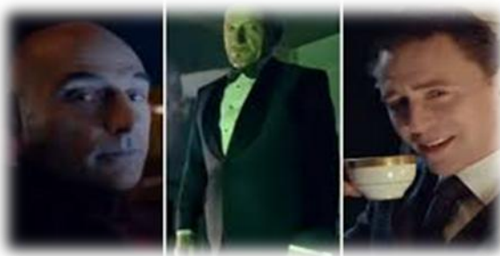
2.8.3. „ცუდი ბიჭები“ იაგუარის ფირმის რეკლამიდან

მაგ. ( ბრიტ.) ამ მხრივ საინტერესოა ბრიტანული მანქანების ბრენდის- იაგუარის ერთ-ერთი მორიგი რეკლამა http://www.youtube.com/watch?v=2Bls1KKDwmo , 2014), რომელშიც უპირველესად თავად მეორადი მონაწილეების როლის შემსრულებელთა წარმოშობაც რელევანტურია . რეკლამაში მონაწილეობს სამი ცნობილი ბრიტანელი მსახიობი- სერ ბენ კინგსლი, ტომ ჰიდელსტონი და მარკ სტრონგი , რომლებიც ერთგვარად განაპირობებენ რეკლამაში ეთოსის, „პერსონის“ ცნებას. აღსანიშნავია, რომ რეკლამაში ისინი „თავიანთ თავებს“ ასახიერებენ, ანუ აუღერებენ ბრიტანელების ხასიათის ირგვლივ სტერეოტიპულად შექმნილ თვისებებს, რომლებიც გემოვნებას, ძალაუფლებას , სტილს, ზრდილობიანობას და ყოველივე „ელიტურს“ უკავშირდება.