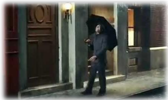
2.6.2. კადრი გოლფის რეკლამირებული მოდელის მანქანის რეკლამიდან, რომელშიც დომინანტურად წარმოდგენილია ქორეოგრაფიული ხასიათის კრეატივი.

რეკლამის ნომინაციურ სლოგანში გამოყენებული ზედსართაული სახელი- original- პოლისემანტურადაც დატვირთულია, რადგანაც, ერთი მხრივ, ნიშნავს თავდაპირველს, ხოლო მისი მეორე მნიშვნელობა ყოველივე ახალ და საინტერესოს, ორიგინალურს უკავშირდება. რეკლამის შინაარსიდან გამომდინარე, უფრო ორიგინალურს ახალს უნდა ნიშნავდეს, თუცა სიტყვასთან- updated-რაც ნიშნავს განახლებულს- ახლოს მისი გამოყენება შეიძლება ორივე სემანტიკურ მნიშვნელობას გამოხატავდეს. ეს გვაძლევს იმის საფუძველს, რომ ვიფიქროთ, სწორედ ამ პოლისემანტურობის ფონზე ახერხებენ კომუნიკატორები, ასე ვთქვათ, „ორი კურდღლის დაჭერას“- ერთი მხრივ, ისინი ერთგულ და ტრადიციების მოყვარულ მომხმარებელს აცნობენ, რომ მანქანა სულაც არ შეცვლილა, ისევე თავდაპირველი სახითაა წარმოდგენილი, თუმცა მხოლოდ რამდენიმე ახალი ელემენტი აქვს დამატებული, და, მეორე მხრივ, მანქანის კრეატიულობაზე ხაზგასმით თანამედროვეობისა და ზებუნებრიობის მოყვარულ აუდიტორიასაც იზიდავენ. ამგვარად, პოლისემანტური სიტყვის გამოყენებაც, ვფიქრობთ, პრაგმატიკული მიზნებით არის განპირობებული.