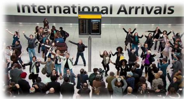
2.6.3. კადრი რეკლამირებული T-mobile მობილური კავშირი რეკლამიდან, რომელშიც დომინანტურად წარმოდგენილია ქორეოგრაფული ხასიათის კრეატივი.

დეკოდირება მათ მიერ ზურგზე გადაკიდებული მუსიკალური ინსტრუმენტის მეშვეობით) და ასე სხვ. საშუალებით.