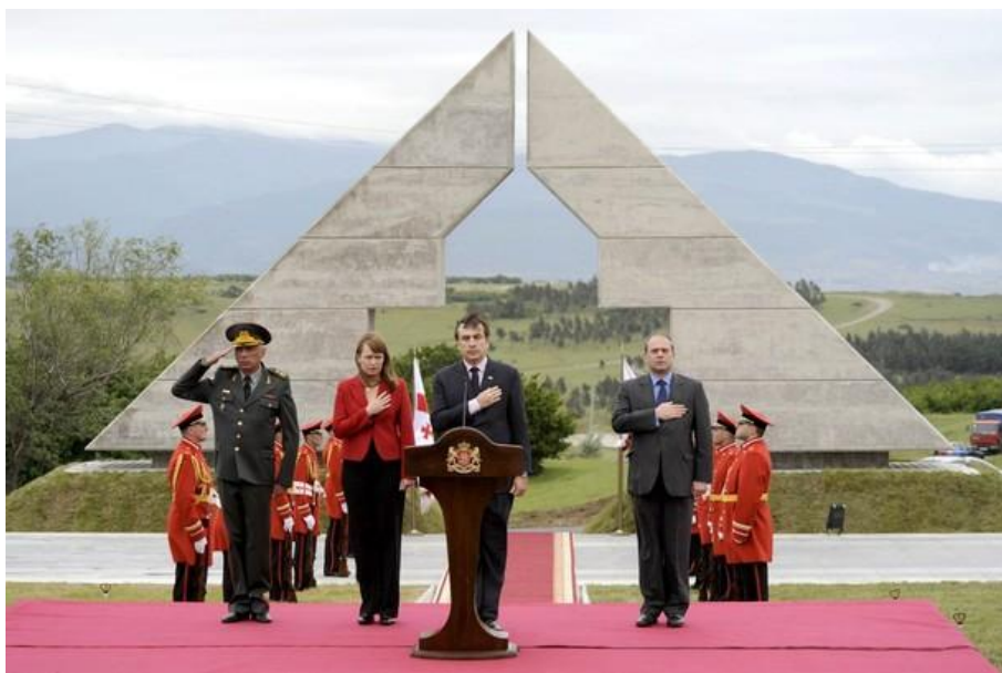
სურათი 6. გმირთა მონუმენტი გმირთა მოედანზე (ხედი დღისით)