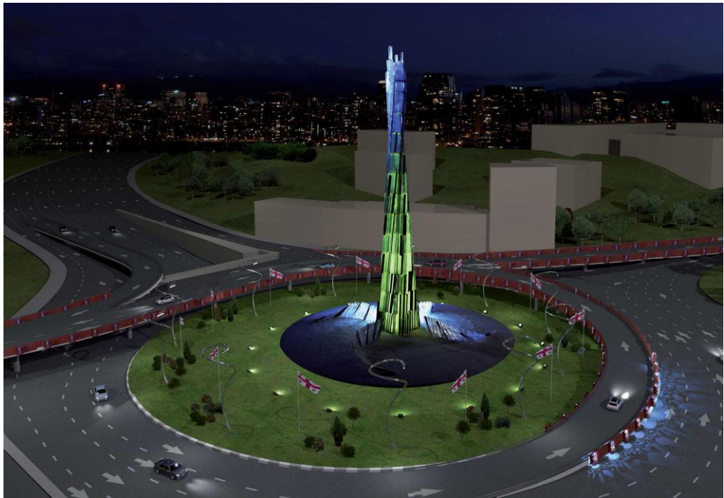
სურათი 12. მონუმენტის საბოლოო სახე