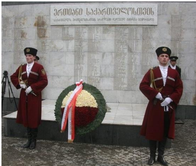
სურათი 10. გმირთა მონუმენტის გახსნა