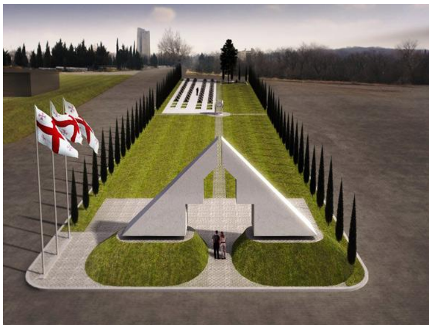
სურათი 4. სახელმწიფოს სიმბოლო მუხათგერდის სასაფლაოზე