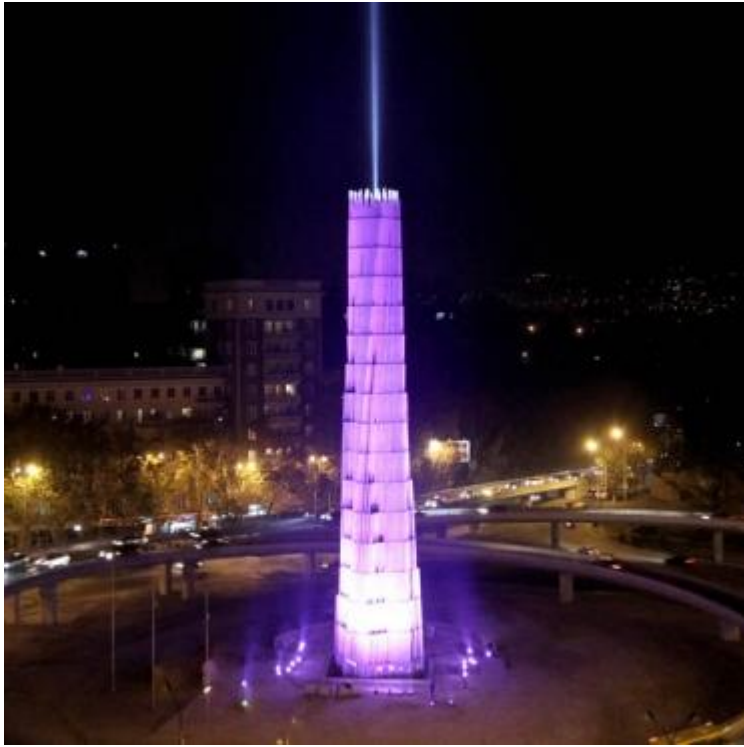
სურათი 8. გმირთა მოედნის გზის პროექტი