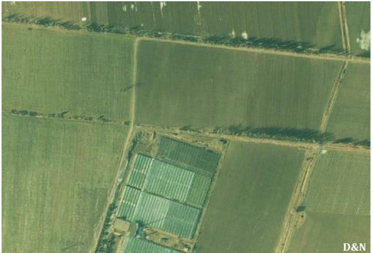
სურათი 14. სოფელი წეროვანი ომის შემდეგ, 2008 წლის დეკემბერი.