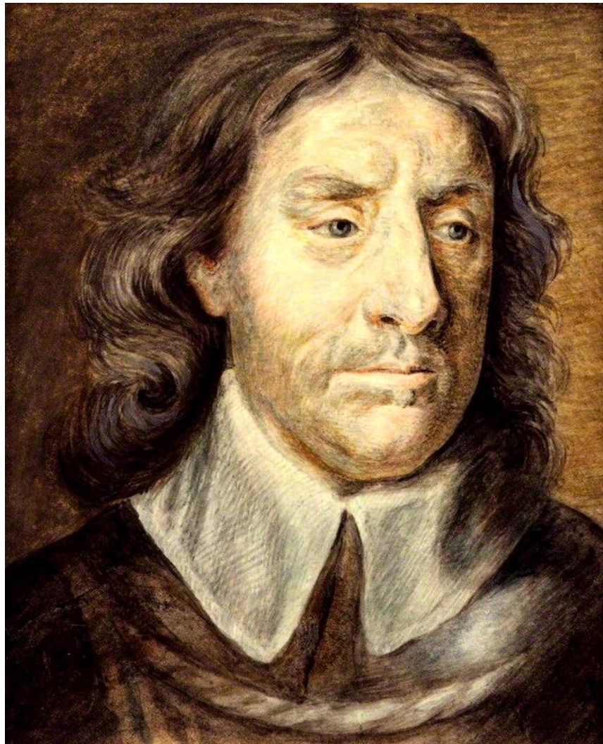
ნახ. 1. ოლივერ კრომველის პორტრეტი. რ. ჰატჩინსონი, 1773. (ს. კუპერის მიერ შესრულებული პორტრეტის (1656) საფუძველზე)

[Milton, J. Paradise Lost, 1962. Bk. 1, 589-94; 599-612 ინტ. წყარო, 22.01.2017]